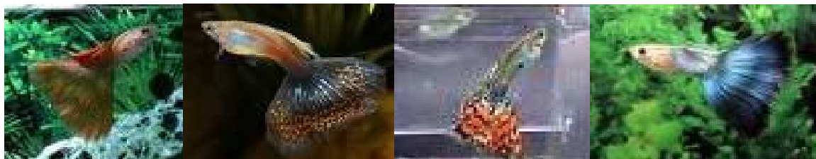
Рисунок 1 - Гуппи – Poecillia reticulata Peters

Гуппи Poecillia reticulata Peters – широко распространенная аквариумная живородящая рыба. Половозрелые гуппи имеют хорошо развитые половые признаки, что облегчает их сортировку. Самцы, как правило, мельче (3–4 см) и имеют более яркую окраску, чем самки. У них преобладают серовато-коричневые тона с очень яркими красными, голубыми, зелеными и черными пятнами. Самки больше самцов, до 6 см в длину, чаще желтовато-зеленые (рисунок 1). Анальный плавник у самок округлый. У молодых самцов он имеет ту же форму, однако со временем, в период полового созревания, он начинает удлиняться и превращается в подвижный гоноподий. Выдерживает значительные колебания солености. Продолжительность жизни 3–3,5 года