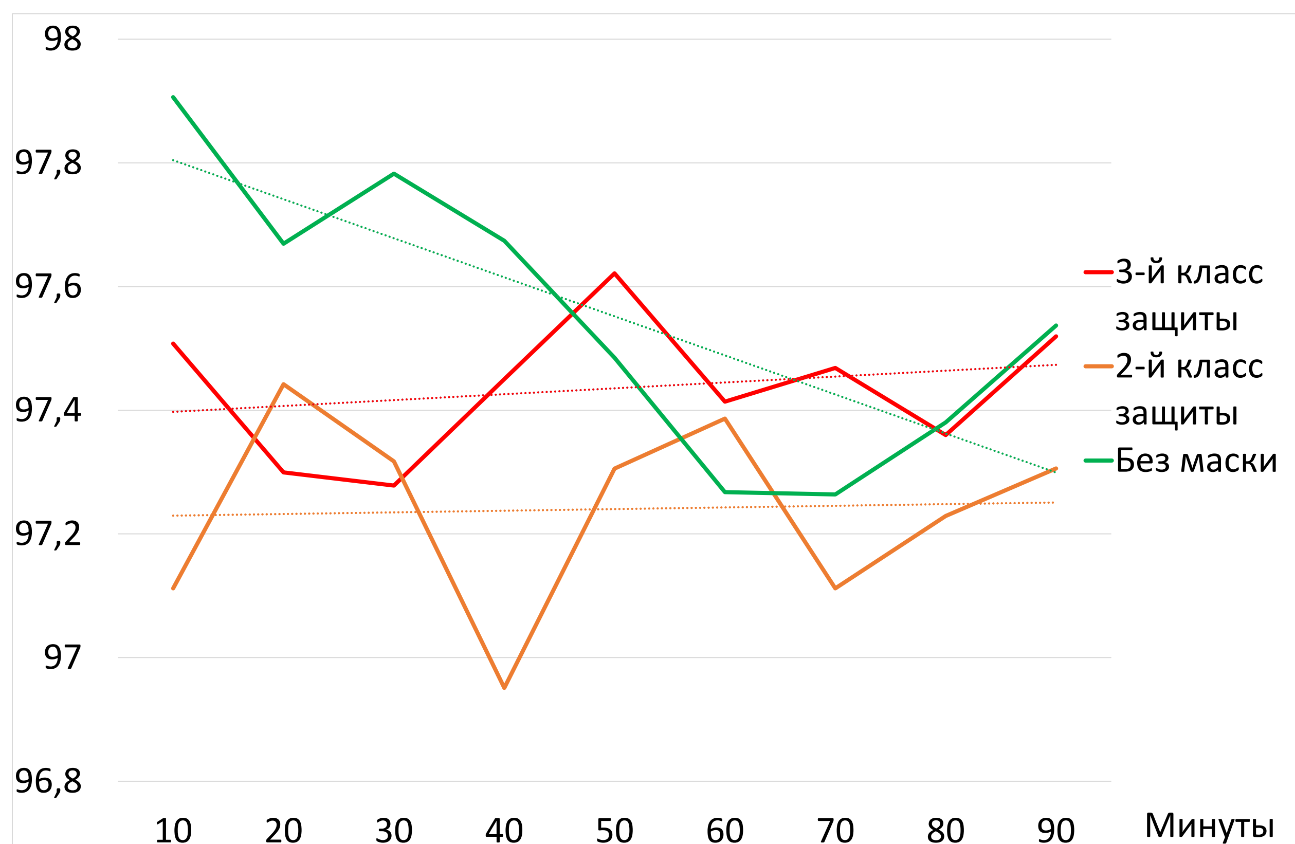
Рисунок 2 – Динамика изменения сатурации за 90 минут измерения